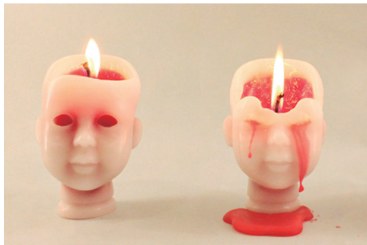
Baby Cary Candle

血の涙ベビー赤ちゃんのくもりのない瞳と首のあたりにかすかにピンク色の血管が埋め込まれ、ちょっと甘いさくらんぼの香りを配合することで、バイオレンスと可愛さを最高の組み合わせで表現しました。