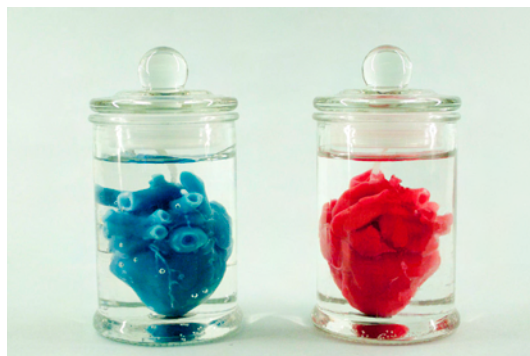
Heart Jar Candle

博物館でしか見られない標本をバレンタインデーに最適のプレゼントとして生かしました。ロマンチックなピーチの香りで最高の愛を届けましょう。