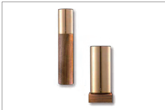
Y Studio Stationery 左)ペンケース、右)ペンスタンド