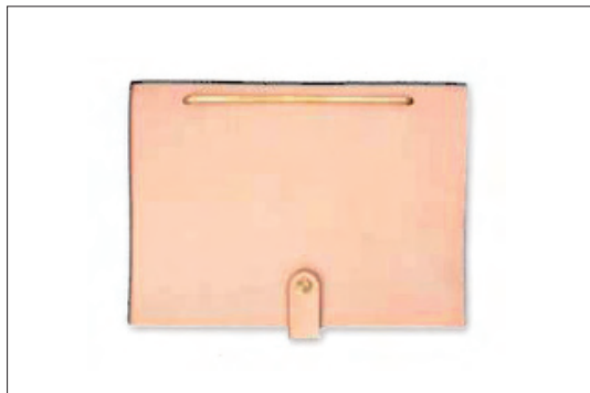
Y Studio Stationery ノート