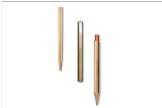
Y Studio Stationery 左2点)ボールペン、右)シャープペンシル