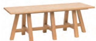
リビングテーブル ¥56,000 (税込)