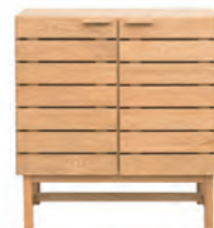
キャビネット ¥69,000 (税込)