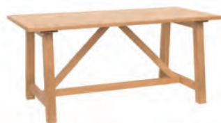
ダイニングテーブル ¥109,999 (税込)