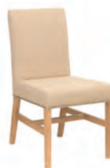
ダイニングチェア ¥34,000 (税込)