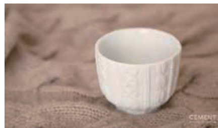
■ Trace Face