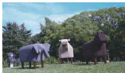
■ Frien'Zoo Stool