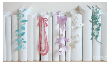
■ SEE OH! Ribbon