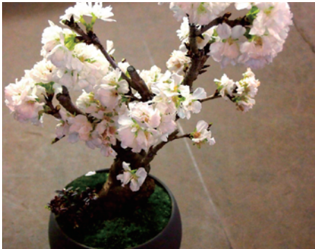
鉢の中に、若い苗木と苔を使って緑のある景色をつくっていく「景色盆栽」。会場では手入れ用の鉢などの道具一式も販売します。

自由が丘で新しいスタイルの盆栽を提案する「品品」による、桜の景色盆栽を作るワークショップです。基本的な土のつくり方や苔の使い方、お手入れの仕方も学べます。