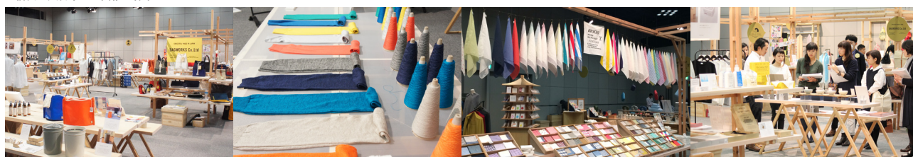
▼前回の大日本一の開催の様子

過去の出展社情報は、こちらから >> http://www.active-design.jp/