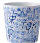
TOKYO ICON カップ 価 格:2,160(税込) サイズ:φ8.5 H8cm