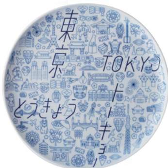
TOKYO ICON プレート(L) 価 格:3,780(税込) サイズ:φ23.5 H2cm