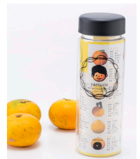
無茶々園の柑橘を使ったレシピシート入り