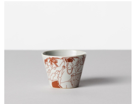
そば猪口 ノンチェリー / オレンジ 価格: ¥2,000 サイズ: Φ8×h6.1cm / 170cc Material 磁器 Made In 波佐見