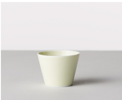
そば猪口 色釉 / 白淡 / 薄黄 価格: ¥1,300 サイズ: Φ8×h6.1cm / 170cc Material 磁器 Made In 波佐見