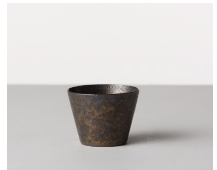
そば猪口 黒みかげ / 銅釉 価格: ¥1,500 サイズ: Φ8×h6.1cm / 170cc Material 陶器 Made In 波佐見