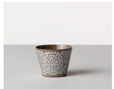
そば猪口 和文 / 銀 / 蛸唐草文 価格: ¥1,800 サイズ: Φ8×h6.1cm / 170cc Material 陶器 Made In 波佐見

《本リリースに関するお問い合わせ》取材依頼、画像貸し出し、ご不明点などございましたらお気軽にお問い合わせくださいませ。