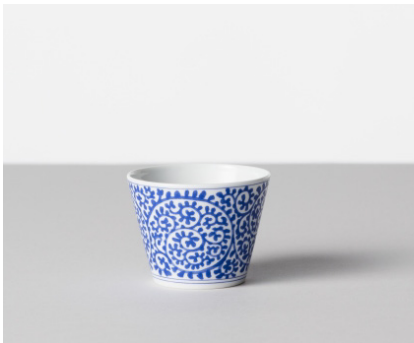
そば猪口 和文 / 青 蛸唐草文 価格: ¥1,800 サイズ: Φ8×h6.1cm / 170cc Material 磁器 Made In 波佐見