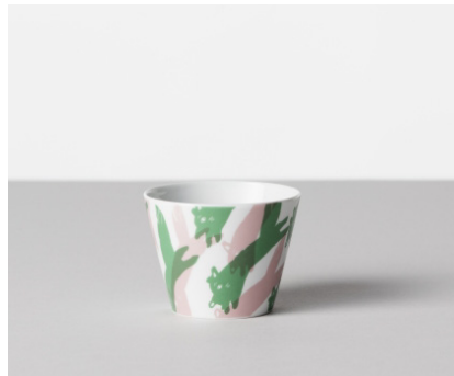
そば猪口 ミンネ / kitsunekakeru 価格: ¥2,000 サイズ: Φ8×h6.1cm / 170cc Material 磁器 Made In 波佐見