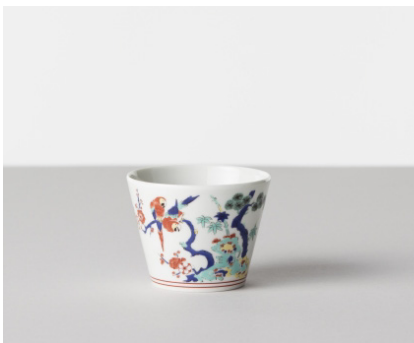
そば猪口 色絵 / コンゴウインコ 価格: ¥1,800 サイズ: Φ8×h6.1cm / 170cc Material 磁器 Made In 波佐見