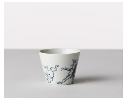
そば猪口 鳥獣戯画 / 相撲 価格: ¥1,500 サイズ: Φ8×h6.1cm / 170cc Material 磁器 Made In 波佐見