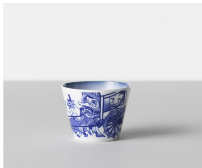
そば猪口 妖怪 / 天狗の牛車 価格: ¥1,500 サイズ: Φ8×h6.1cm / 170cc Material 磁器 Made In 波佐見