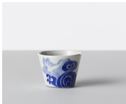
そば猪口 古典染付 / 波宛文 (なみうさぎもん) 価格: ¥1,800 サイズ: Φ8×h6.1cm / 170cc Material 磁器 Made In 波佐見