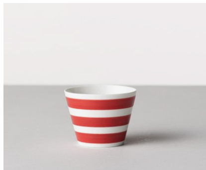
そば猪口 三本線 / レッド 価格: ¥1,300 サイズ: Φ8×h6.1cm / 170cc Material 磁器 Made In 波佐見