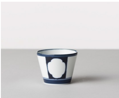
そば猪口 間取 / 四つ葉文 価格: ¥1,500 サイズ: Φ8×h6.1cm / 170cc Material 磁器 Made In 波佐見