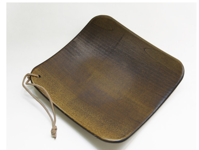
NODATE EX Plate R30 ¥3,000( 税別 )