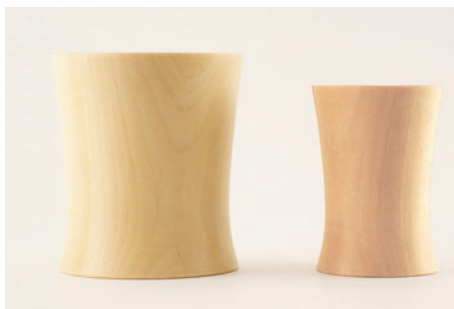
SEME TSUBAKI Tea_cup U ¥6,400( 税別 )