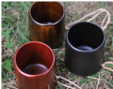
NODATE mug tanagocoro ¥4,500( 税別 )

430 年以上続く会津塗の産地、森と湖のくに、会津で、「漆のある暮らし・遊び」をコンセプトに新しい挑戦を続ける (株) 関美工堂。昭和 21 年創業の歴史ある同社は、会津塗の技術を活かして、世界で初めて表彰で贈られる「楯」を発案・製品化した会社でもある。