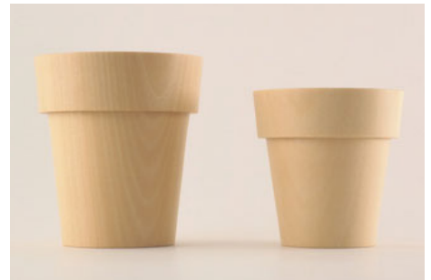
SEME Obi_cup ¥4,800( 税別 )