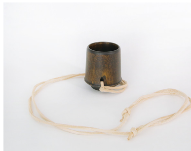
NODATE choco ¥4,000( 税別 )