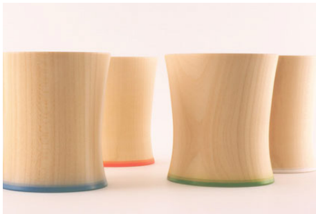
SEME TSUBAKI Tea_cup ¥5,000( 税別 )

会津の伝統工芸品等を、現在のライフスタイルに合った商品として再生させ、新たな伝統として継承していくことを目指す物づくり・人づくり企業です。郷土の工芸技術において、繊細かつ柔軟な物作りが可能な職人のかかえ、製販一体となった商品開発を得意としております。