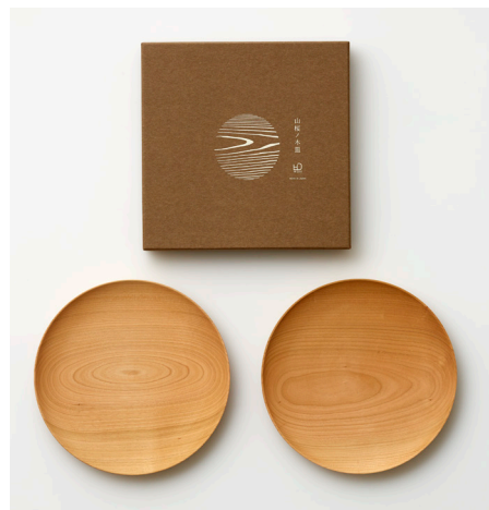
中皿／朝食に使うパン皿や軽食など頻繁に使われるお皿

製造:日本 福島県会津若松 ●素材:天然木(山桜) ●サイズ:φ21cm ●価格:中皿2枚セット:10,000円(税抜)