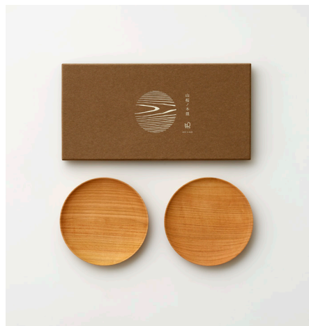
取皿／取り分けるお皿や和菓子やケーキなどのスイーツをのせるお皿

製造:日本 福島県会津若松 ●素材:天然木(山桜) ●サイズ:φ21cm ●価格:中皿2枚セット:10,000円(税抜)