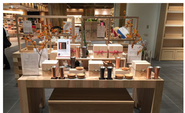
ショップイメージ

《本リリースに関するお問い合わせ》取材依頼、画像貸し出し、ご不明点などございましたらお気軽にお問い合わせくださいませ。