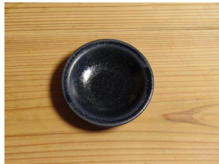
SHIROUMA 豆皿（青色） 醤油皿やお茶請けとして。カップ類にサイズが合うようにして、 カップとカップの間に豆皿を挟むようにし、スタッキングが出来る ようにしています。色の名前は、馬の毛色からとりました。