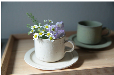
SHIROUMA コーヒーカップとソーサー（月色と芦色）