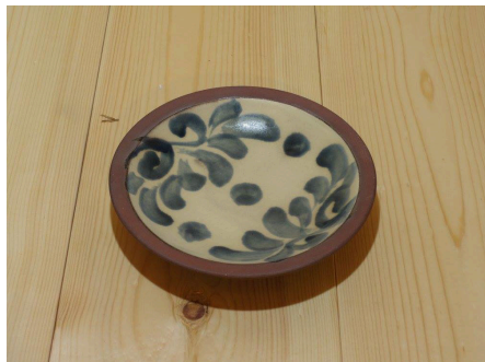
やちむん取り皿 沖縄で陶器のことを「やちむん」と呼びます。 ふくよかな厚みと温かみのある絵付けが特徴の取り皿です。

商品のご紹介（一部） 普段使いいただけるよう、1,200～5,500円の作品を中心に展覧いたします。