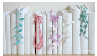
■SEE OH! Ribbon

《本リリースに関するお問い合わせ》取材依頼、画像貸し出し、ご不明点などございましたらお気軽にお問い合わせくださいませ。