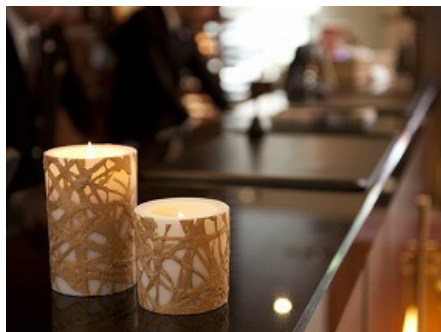
ビラー / 龍金

サイズ: 大/直径 100mm× 高さ 150mm 価格: 9,000 円 中/直径 100mm× 高さ 100mm 価格: 7,000 円 香り: 凜 (フローラル系)、無香料