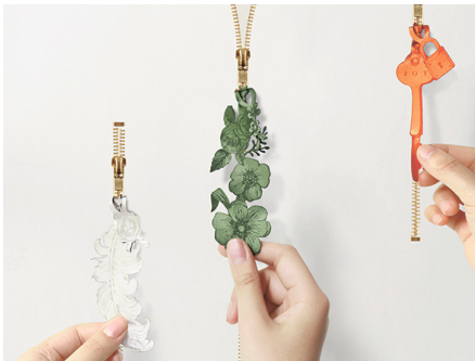
カラー: pink / green