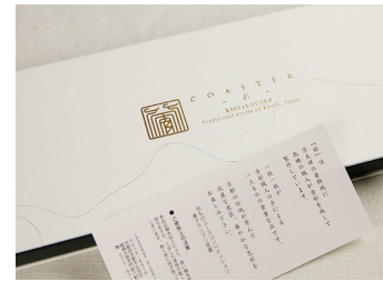
COASTER 一彩ー 6 マイ入り