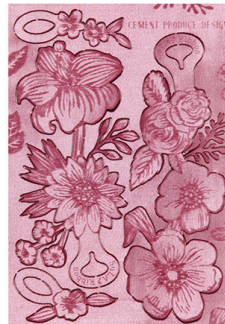
価格: 600 円 (税抜)