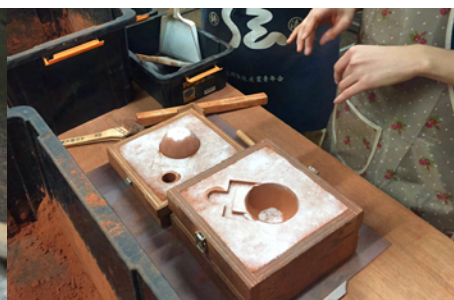
鋳物体験 高岡の地に400年伝わる鋳造技術。伝統的な「砂型」での金属鋳物作りを体験します。