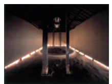
内藤礼『このことを』2001年 家プロジェクト「きんざ」 直島

1951年東広島市生まれ。広島大学学長室特任教授、前・国立天文台台長。京都大学大学院理学研究科博士課程修了。専門は理論天文学で、星・惑星系の形成過程、系外惑星の探査などを研究。浄土真宗本願寺派の僧侶でもある。著書に「新しい宇宙の探求」(岩波書店)、「太陽系外の惑星に生命を探せ」(光文社)、など。