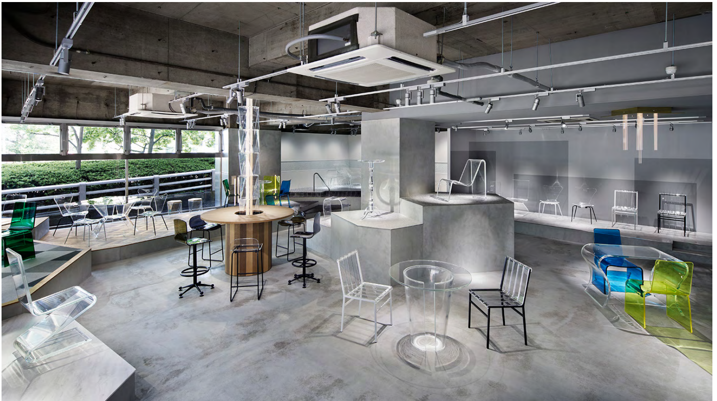
FUTA Moriishi