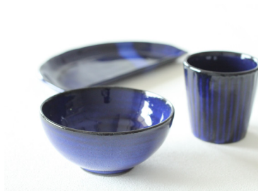
ナイトブルーがもてなす、映える夕食 シリーズ 価格: ¥2,300円~ (税抜)