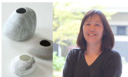
KOISHI MARBLE 価格: ¥4,800 (税抜)