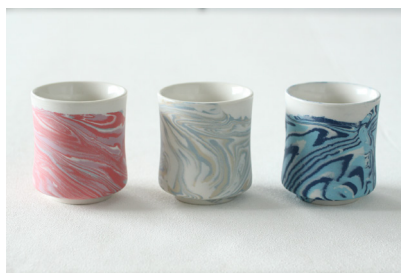
練り込み湯呑 価格: ¥2,500 (税抜)