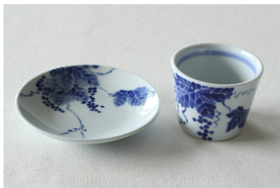
染付墨弾き草花フリーカップ・小皿 価格: 各 ¥3,500 (税抜)