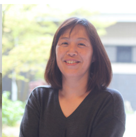
芳泉窯 北邑栄利子