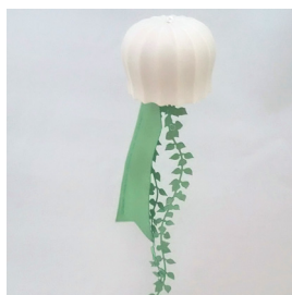
風りぼん (リボン別売) 価格: ¥2,400 (税抜)