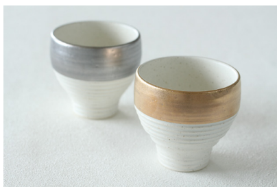
一彩杯ー ペアカップ 価格: ¥7,000 (税込)