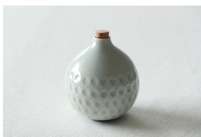
手彫り輪挿し 価格: ¥3,500 (税抜)