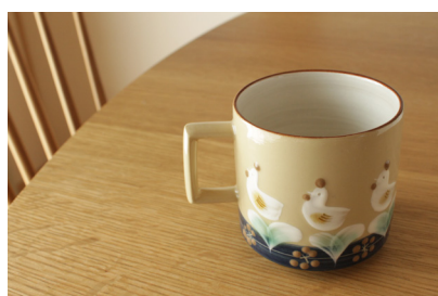
マグカップにわとり 価格: ¥2,500 (税抜)