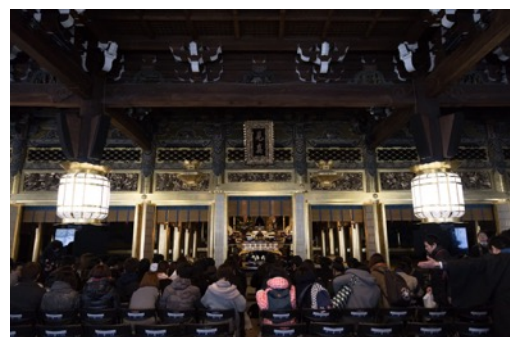
2017年2月京都開催のレポート動画公開中！ https://youtu.be/DVNuA0hNN0c

僧侶に加え、多様な分野の最前線で活躍する講師陣、精進料理や地域ならではの食、日本の伝統文化、など多様なプログラムを用意し、2017年2月に京都、3月に富山で開催されました。企画運営に参画してくれたサポートメンバー含め約250名の10～20代の若者が参加し、約90の媒体で紹介されるなど大きな注目を集めました。