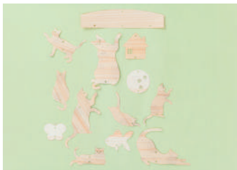
木の紙モバイル / 各600円(税別) ネコと金魚 / ネコとお家 / ネコとちょうちん 素材：ヒノキ