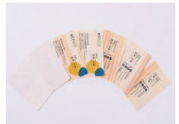
木の紙名刺 / 40枚2,600円(税別)～ 100枚5,300円(税別)～ 素材：杉、ヒノキ、赤松、桜、黒松、琉球松