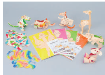
木の紙スナップ 動物シリーズ / 各1,980円(税別) ゾウ、カンガルー、キリン、クマ サイズ：A4サイズ 素材：ひのき or 赤松