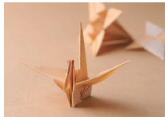
木の折り紙 / 4,300円(税別) A4サイズ10枚入り 素材：杉