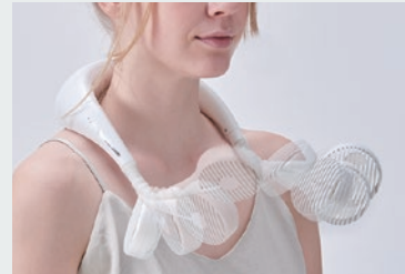
好みの角度に調節できるフリーアーム仕様

左右のファンは好みの角度に調節できるフリーアーム仕様。好みに応じて自在に変化させて使えます。強弱2段階から風量を選べ、約5時間の充電で強モードなら約2時間、弱モードなら約3時間使用できます。切り忘れを防ぐ30分の自動オフタイマー付き。