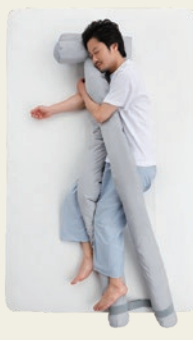
⑩ 枕&抱き枕スタイル