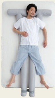
⑤ ハンモックスタイル