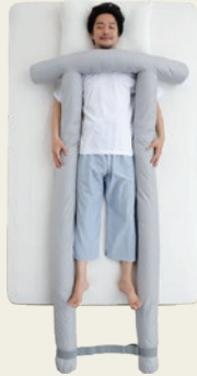
① 掛け布団スタイル