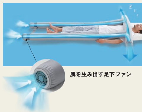
風を生み出す足下ファン

弾力性のある三次元ファイバーやポリエステルわたなどで構成された3つの筒状の部位を組み合わせた、まるで鳥居のようなユニークな寝具は、かけ布団のように使ったり、しき布団のように使ったり、抱き枕のように使ったりと自由自在。どんな眠りのスタイルにもフィットして、雲の上にいるようなリラックスした眠りをお届けします。さらに足元には2つのファンを搭載。寝具の中を風が流れて熱と湿気を排出し、サラッと快適な寝心地を実現させています。冬は電源を入れず、かけ布団をかければ自由な寝心地はそのまま、中に空気層が生まれてあたたかく。一年中使える新スタイルの寝具の誕生です。