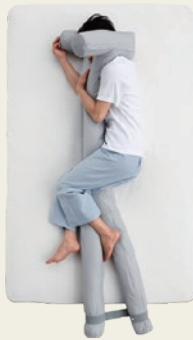
⑨ 包まれ枕スタイル