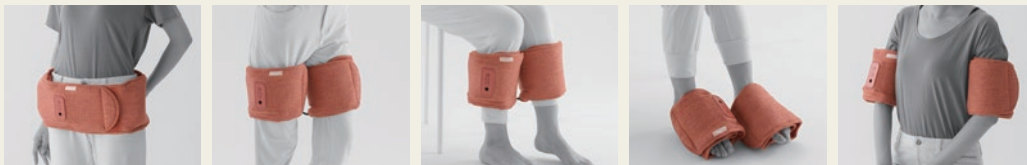
骨盤まわり・お尻

骨盤周りやお尻にくるりと巻いてマッサージができ(対応サイズ約70~110cm)、ベルト部分を2つに分割すれば、両脚(太もも、ふくらはぎ、足裏/対応サイズ約22~55cm)や両腕にも装着ができ、全身くまなくマッサージができるフレキシブルな設計です。