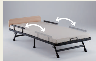
取り付け位置が選べるグリップ