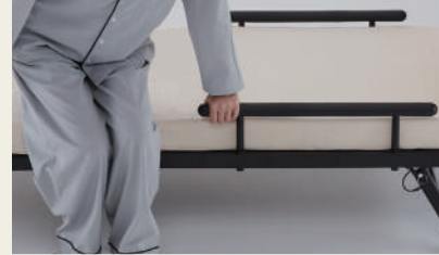
立ち上がりや布団の滑り止めの補助に