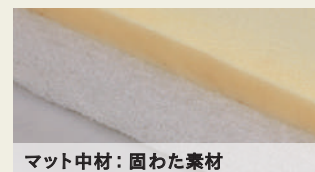
マット中材：固わた素材

マット表地にはニュアンスのあるアイボリーの織り生地を採用しました。別売で専用のボックスカバー（グレー、ライトグレー、アイボリーの3色）を用意しています。