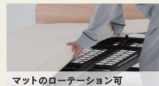
マットのローテーション可