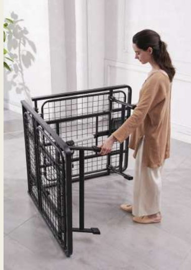
組み立て設置カンタン

長さ2mのベッドフレームを2分割。小さく折り畳んだ状態で納品されますので、搬入経路を選ばず様々な居住空間への設置が可能です。模様替えや引っ越し、収納にも便利です。また、組み立ては広げてヘッドボードとグリップを差し込むだけと簡単。立ち上がりがラクになり、布団の滑り落ちも防ぐグリップは設置場所や使用用途に応じて取り付け位置が選べる仕様になっています。