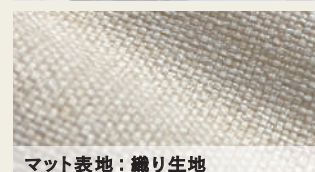
マット表地：織り生地