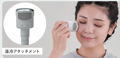
温冷アタッチメント

温冷アタッチメントは取り外して、フェイスケアにも使えます。ホットモードは目もとや首、クールモードはお肌のひきしめとしておすすめです。