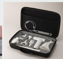
ケースサイズ： (約) W390×D255×H90mm