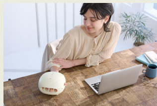
デスクワークの合間に